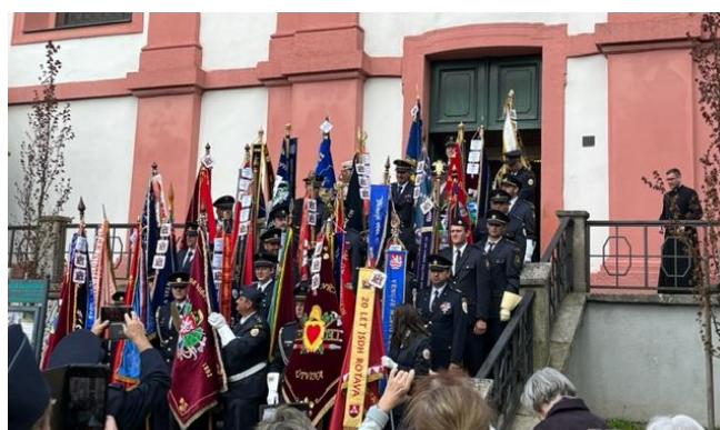
Sraz historických praporů v Chodově