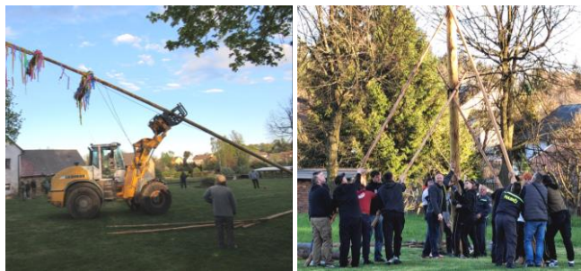
Stavění máje před pěti lety a dnes

Čarodějnice, čarodějky, v noci létají na koštěti, přinášejí kouzla a magii, kamkoliv chtějí letí.