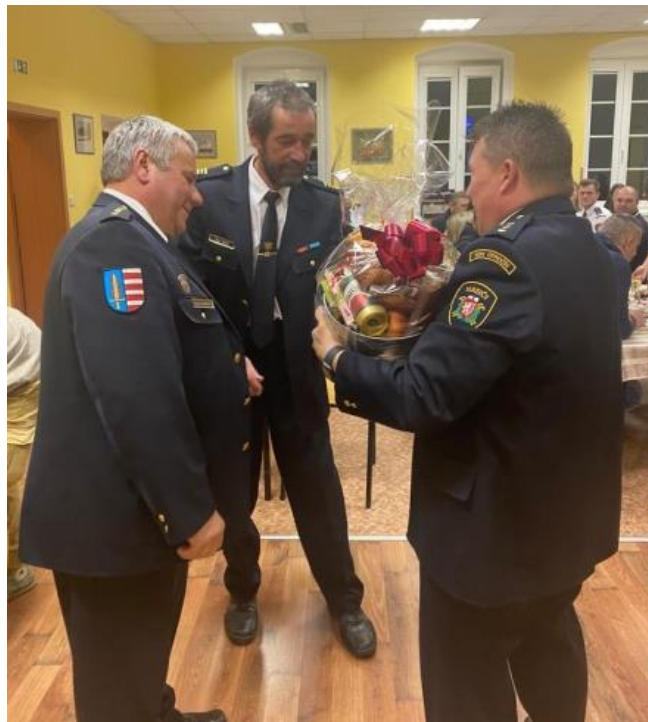
Předání ocenění na VVH

V červnu již tradičně proběhl Mezinárodní den dětí, který jsme zorganizovali pro nejmenší obyvatele okolních obcí společně se svazem žen. Na konci června proběhlo kácení Májky a její dražba. V letošním roce došlo k ručnímu odnosu vydražené Májky našimi členy až na místo určené novým majitelem. ☺