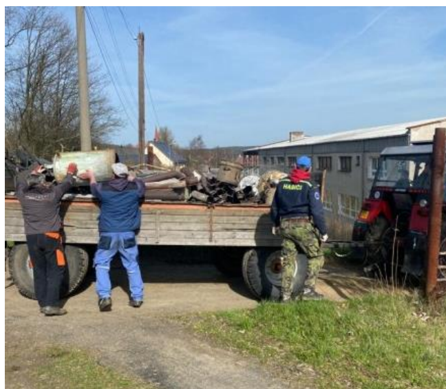
➔ Sběr kovošrotu